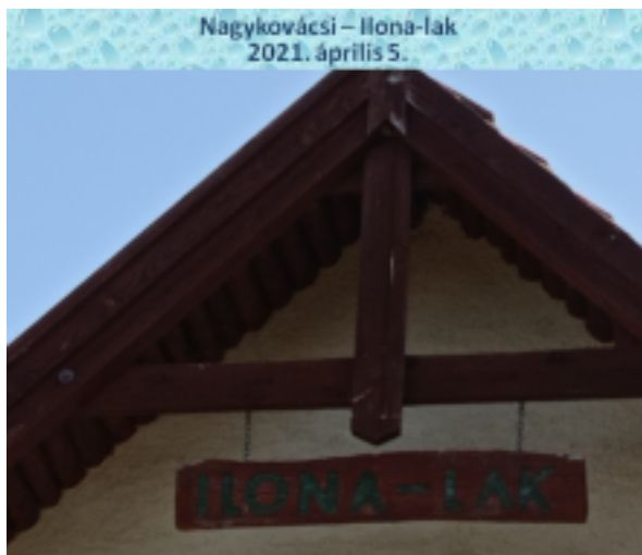
Nagykovácsi – Ilona-lak 2021. április 5.

ILONA-LAK! Mire érkeztünk? Kinek a kedvence, szereplője, előreléptető szereplője? Ezek az a kérdések, amelyekre a válaszokat a helyszínen kell majd megkeresnünk. Az egyiket már meg is láttuk, a többi után még felfedeztük!