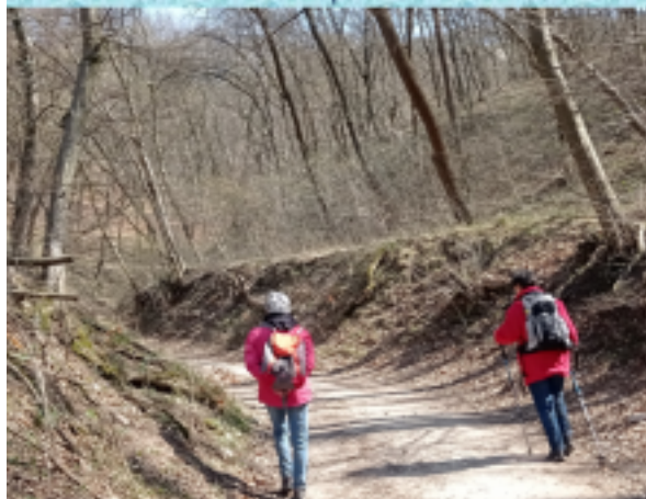
Nagykovácsi – Ilona-lak 2021. április 5.