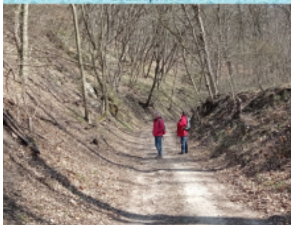
Nagykovácsi – Ilona-lak 2021. április 5.