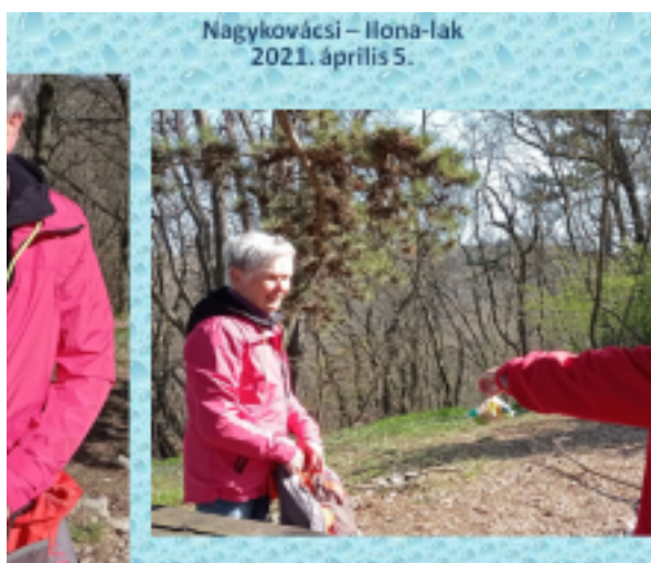
Nagykovácsi – Ilona-lak 2021. április 5.

ILONA-LAK! Mire érkeztünk? Kinek a kedvence, szereplője, előreléptető szereplője? Ezek az a kérdések, amelyekre a válaszokat a helyszínen kell majd megkeresnünk. Az egyiket már meg is láttuk, a többi után még felfedeztük!