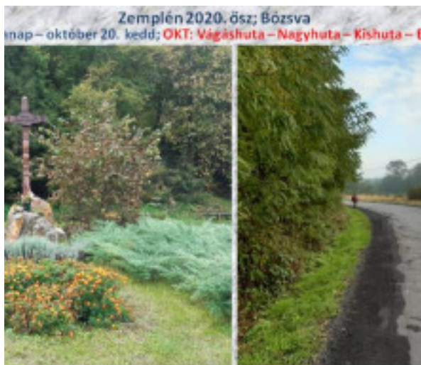
Zemplén 2020. ősz; Bózsva nap – október 20. kedd; OKT: Vágáshuta – Nagyhuta – Kishuta – F

o parkol a kerítés mellett, vajon mire lehet ezt még hasz tőleg majd nem az erdő egy elhagyott sarkában lesz vég