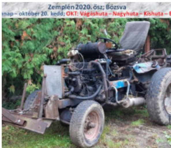
Zemplén 2020. ősz; Bózsva nap – október 20. kedd; OKT: Vágáshuta – Nagyhuta – Kishuta – F

gél félnyolckor már megerkeztünk a kiindulóponttra, Vágáshuta község t a mobil applkáció, majd a túra végén megtudjuk a pontos lépésszám