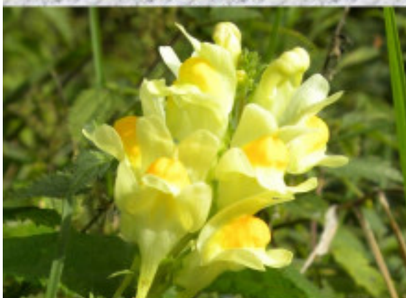
Vadtátika (Gyűjtőványfű), gyógynövény. A máj orvosa. MÁV Zrt. partnerünk és fő támogatónk.

Mátraháza-Galyatető-Mátraszentistván 2020. október 10.