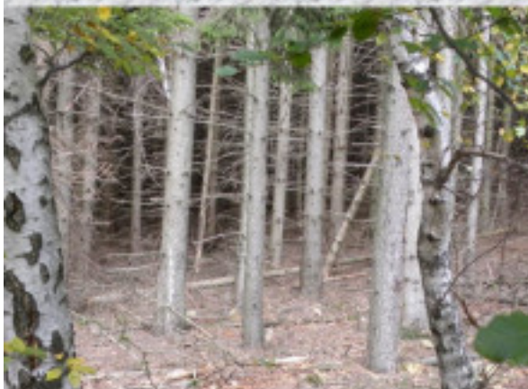
Telepített lucfenyők az erdőben. MÁV Zrt. partnerünk és fő támogatónk.

Mátraháza-Galyatető-Mátraszentistván 2020. október 10.