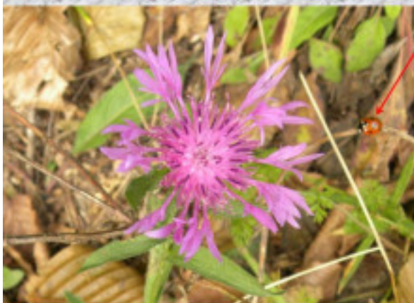
pettyes Katica közelít a szirmokhoz. A virág: a réti imola. MÁV Zrt. partnerünk és fő támogatónk.

Mátraháza-Galyatető-Mátraszentistván 2020. október 10.